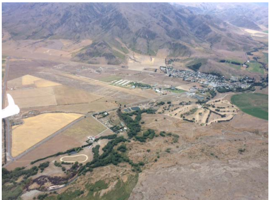
Het vliegveld van Omarama

Rond half één zouden we de lucht ingaan. We kregen elk een Duo-Discus toegewezen. Dan kwam verrassing nr 1 : onze duo's stonden na de briefing reeds startklaar op de runway voorzien van batterijen, zuurstof, de nodige hoeveelheid water in de staart, logger en spot tracker! Een shuttle rijdt de piloten tot aan de toestellen en je hoeft letterlijk alleen maar in te stappen en te vertrekken. Plezant maar een in mijn ogen overbodige luxe. Het wordt dan ook meteen duidelijk waarom het vliegen in Omarama zo prijzig is. Voor dit alles is