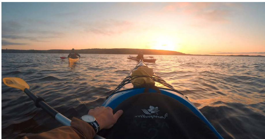
Sunset op het water in de achtertuin

Na een prachtige zonnige zaterdag, toen we al kajakkend naar een klein eilandje zijn gevaren, was het zondag eindelijk tijd om het mooie Finland eens vanuit de lucht te gaan ontdekken. Een kort introductievluchtje met Kai in de ASK-21 om de omgeving en procedures te leren kennen werd gevolgd door twee mooie vluchten in Kai's Mini Nimbus, een toestel dat van André Ruymen is geweest en jarenlang in Goetsenhoven gevlogen heeft als OO-ZMS. Een unieke ervaring om het land van de duizenden meters vanuit de lucht te kunnen ontdekken in een unieke zwever als de Mini Nimbus.