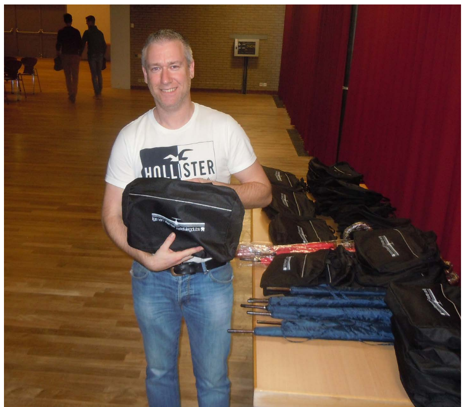
Bart bij de uitreiking van de Charron-prijzen