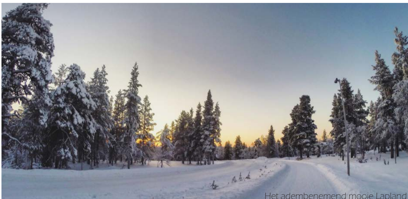
Het adembenemend mooie Lapland