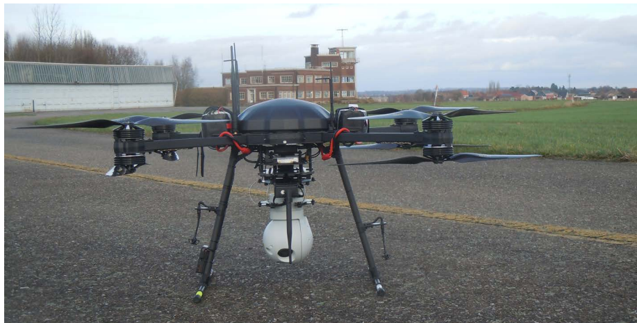
Eén van de drones van de Federale Politie