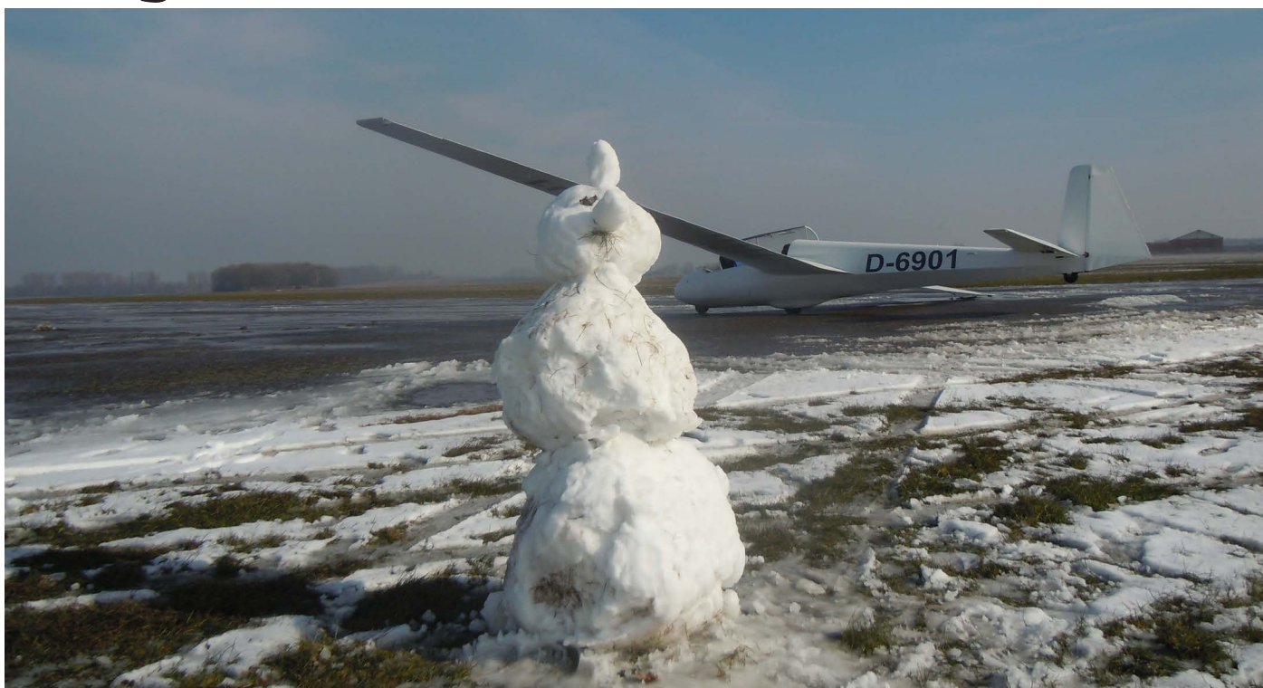
Ook bij sneeuw werd er gevlogen onder het waakzaam oog van de sneeuwman