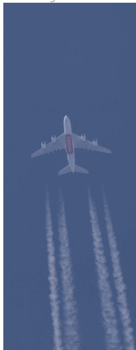
Hoogvlieger boven EBTN