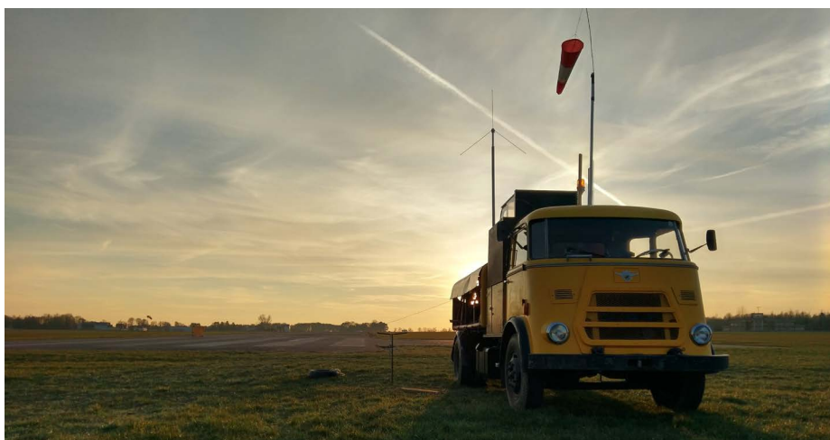
Bijna sunset. Nog één lierstart...