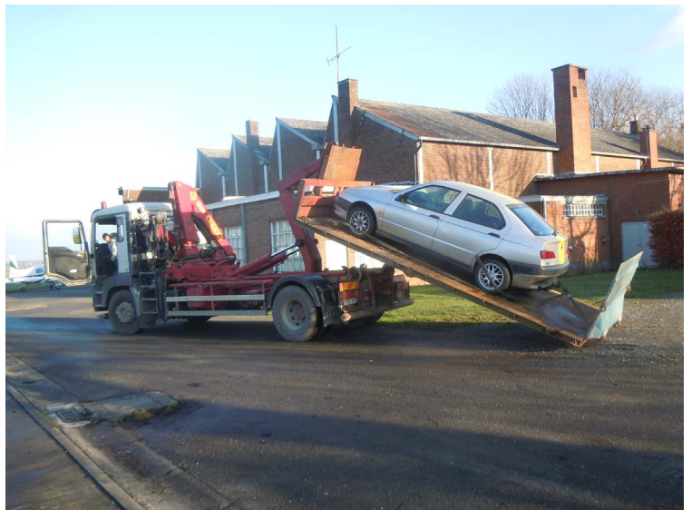
De Alfa Romeo, klaar voor de schroothoop