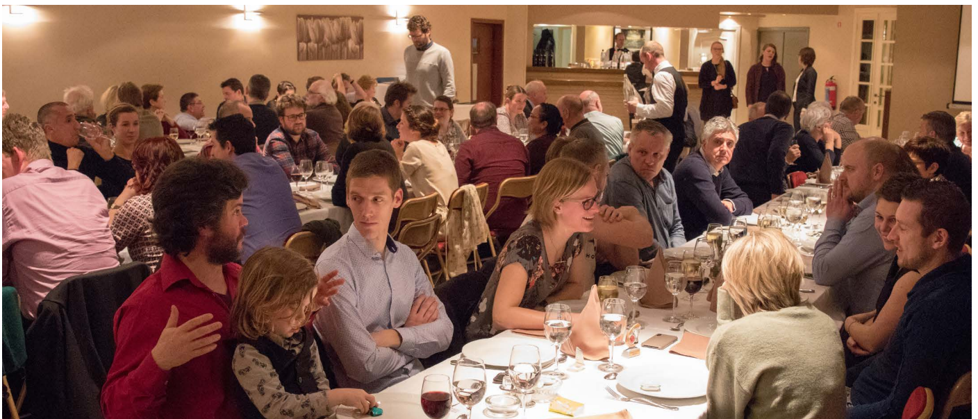
Zaal Vogelzang was gezellig goed gevuld voor onze vleugeluitreiking

Naar aanleiding van het indienen van onze nieuwe milieuaanvraag werden opnieuw 215 bezwaarschriften, met veel onwaarheden, ingediend tegen De Wouw. Een club die reeds 87 jaar gehuisvest is