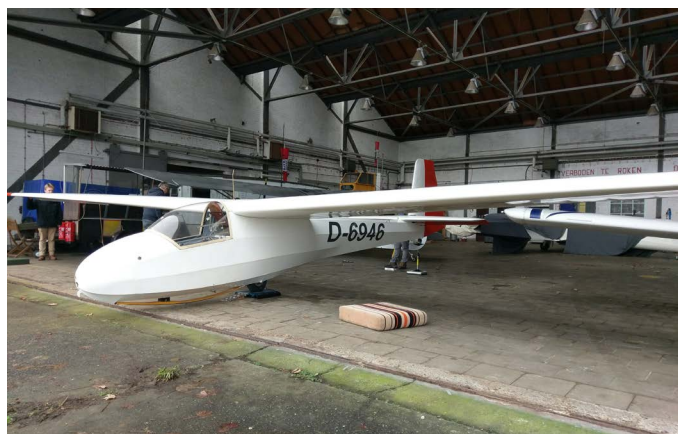
Weging van de Ka8 voor het vernieuwen van de ARC