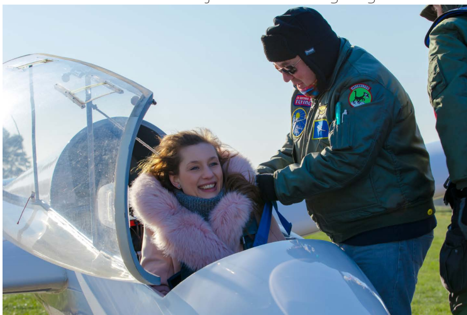
Zelfs bij -5 °C komen er initiatievluchten langs