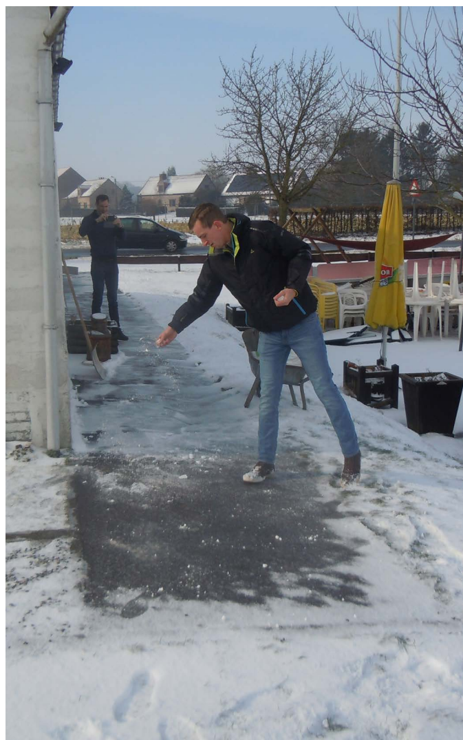
Senne bij het sneeuwvrij maken van de stoep